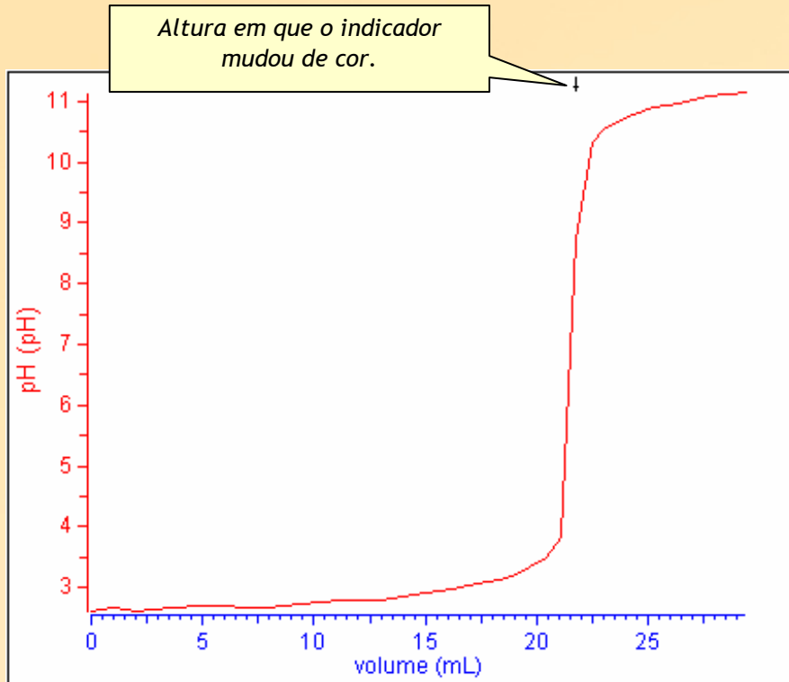
Gráfico obtido após tratamento de dados no Excel

Titulação com incrementos de volume (Logit lab - snapshot)